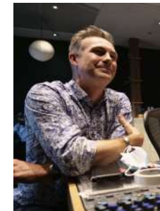
Niobe Thompson / Ναϊόμπι Τόμσον

Η Ντανιέλα Ορτέγκα είναι βραβευμένη κινηματογραφίστρια, με ειδικευση στην αφήγηση πολυσύνθετων ιστοριών με καινοτόμες μεθόδους. Το ενδιαφέρον της επικεντρώνεται σε θέματα επιστήμης, τεχνολογίας, φύσης και ιστορίας. Είναι η δημιουργός του ντοκιμαντέρ «Άνθρακας: μια ανεπίσημη βιογραφία», στο οποίο εργάστηκε ως σεναριογράφος και συν-σκηνοθέτιδα.