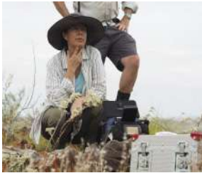
Daniella Ortega / Ντανιέλα Ορτέγκα

Η Ντανιέλα Ορτέγκα είναι βραβευμένη κινηματογραφίστρια, με ειδικευση στην αφήγηση πολυσύνθετων ιστοριών με καινοτόμες μεθόδους. Το ενδιαφέρον της επικεντρώνεται σε θέματα επιστήμης, τεχνολογίας, φύσης και ιστορίας. Είναι η δημιουργός του ντοκιμαντέρ «Άνθρακας: μια ανεπίσημη βιογραφία», στο οποίο εργάστηκε ως σεναριογράφος και συν-σκηνοθέτιδα.