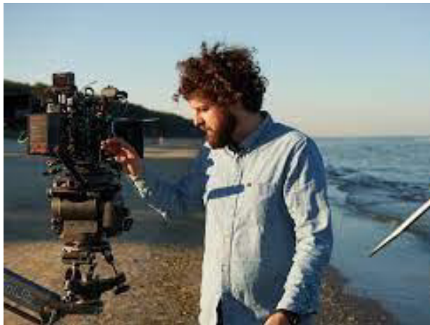
Τουντόρ Βλαδίμηρος Παντούρου (Διευθυντής Φωτογραφίας)

Ο Τουντόρ Βλαδίμηρος Παντούρου είναι ένας Ρουμάνος κινηματογραφιστής, παθιασμένος με την οπτική αφήγηση. Γεννημένος το 1989 στη Ρουμανία, ο Τουντόρ ανέπτυξε την οπτική του ευαισθησία μέσω της φωτογραφίας πριν σπουδάσει κινηματογράφο στο Εθνικό Πανεπιστήμιο Κινηματογράφου και Θεάτρου.